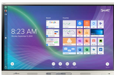
KEIČIANTIS ŽAIDIMO TAISYKLES