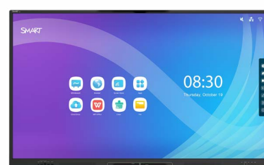
GERESNIS ĮPRASTAS EKRANAS